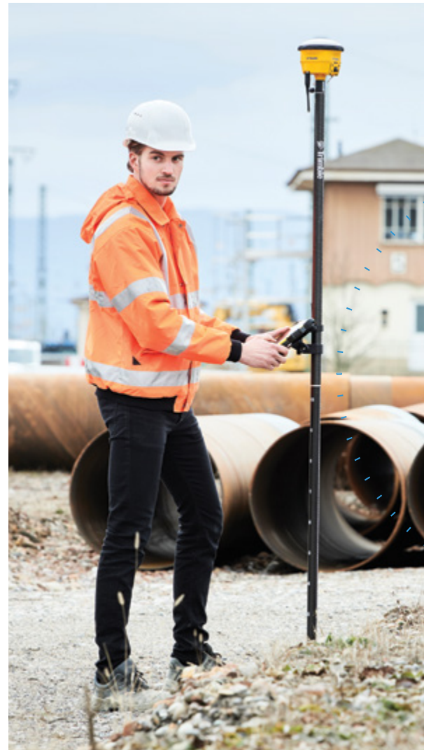
Naturlige kommandoer og bevegelser